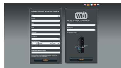
Portail permettant la création du compte utilisateur

Le portail s'adapte à tous les terminaux mobiles et à leurs différents formats d'écran.